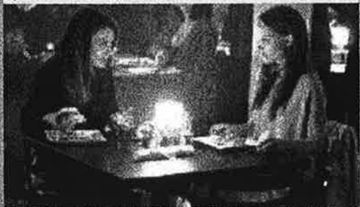
Partners LA STAMPA

SHIRIN NESHAT SCEGLIE «VERANO DE GOLIAT»